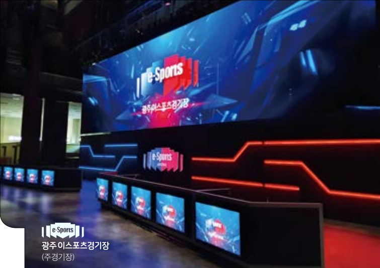
e-Sports 광주 e스포츠경기장 (주경기장)