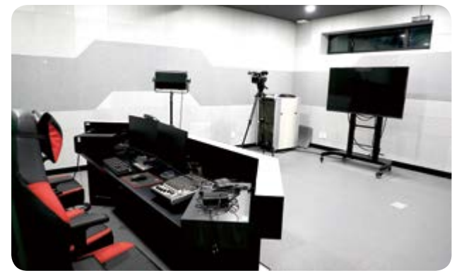
광주 e스포츠경기장 (스튜디오)